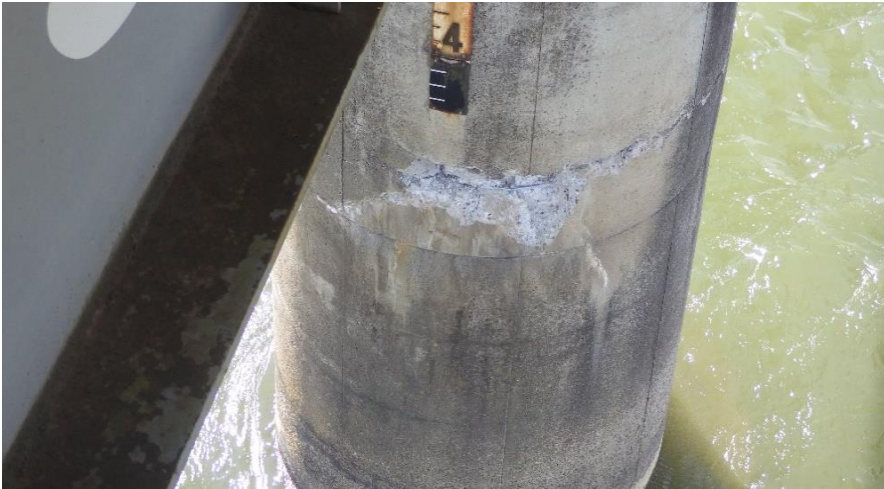
①線路施設（土木）関係 【第1阿武隈川橋梁 橋脚損傷及びクラック】